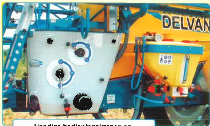
Handige bedieningskranen en afschermkappen. Domix in rijpositie