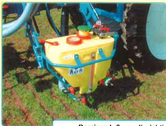
Domix vul- & spoelinrichting in vulpositie